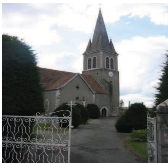
L'Eglise de MASLACQ