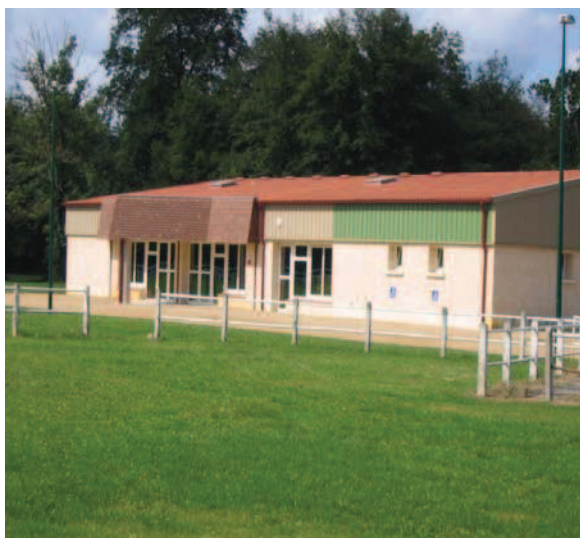
La salle des Fêtes

En outre, la commune est dotée de quelques équipements publics pour compléter l'offre de service relevant du secteur privé.